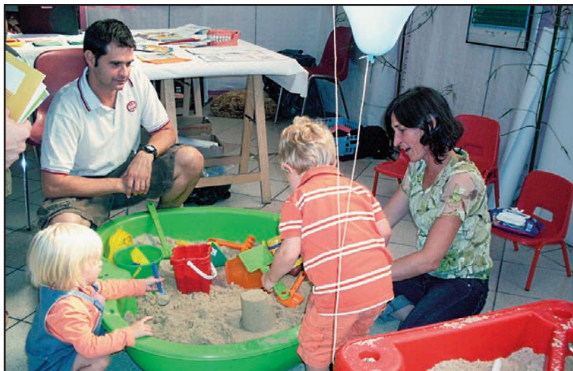
Une animation du R.A.M "Le trait d'Union".

En 2009, la Communauté de communes a consacré 27 % de son budget de fonctionnement à ces actions.