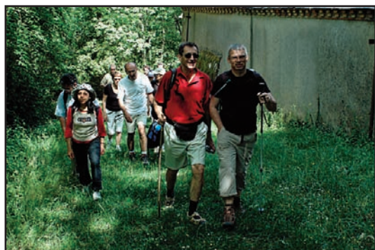
La randonnée pédestre, une activité développée par l'Office de Tourisme sur l'ensemble du territoire.

L'office de tourisme a créé une "commission patrimoine" composée de participants des communes de la Communauté de communes afin de retracer et de recenser sur tout le territoire de celle-ci, l'histoire des villages, des lieux et des immeubles, de répertorier le petit patrimoine, de mettre par écrit la mémoire contemporaine orale. Cette commission est composée d'hommes et de femmes passionnés par le passé et l'avenir de leur territoire.