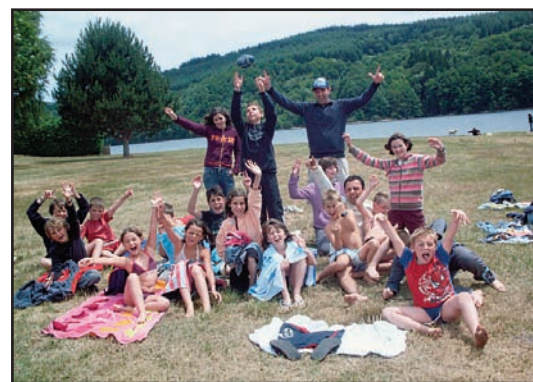
Une sortie plein air organisée par l'Association Centre Social de l'Autan

La Communauté de communes du Pays de Cocagne a signé une convention avec le Centre social de l'Autan. Mél : centre-social-autan@wanadoo.fr