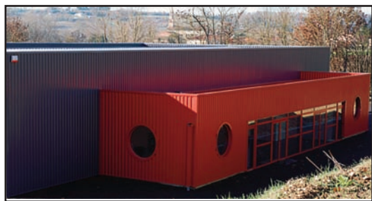
Belle enseigne pour une Zone d'Activité en devenir

Acquéreur du lot N°1, M. Massol a été le premier à installer son entreprise sur la zone d'activités du Girou. Après de gros travaux de nivellement, il a construit un bâtiment de 400 m 2 , conforme aux besoins de ses deux sociétés : D2M et Chronopliage. La première est une entreprise de menuiserie d'aluminium qui emploie 4 ouvriers et dont le bassin d'activité couvre le triangle Bordeaux, Limoges, Montpellier. La seconde est un atelier de serrurerie pour la confection de pièces de tôles variées pour une clientèle locale. Un