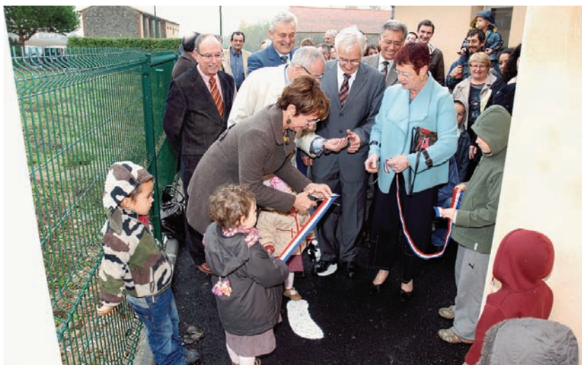
Inauguration de la crèche "les Petits Explorateurs" de Cuq-Toulza

Faisons vivre l'espoir et bâtissons ensemble un avenir plus chaleureux. Henri de Coignac